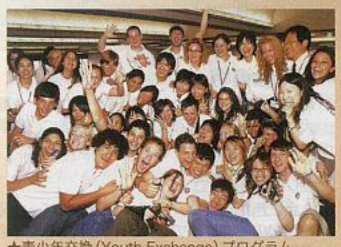
★青少年交換 (Youth Exchange) プログラム